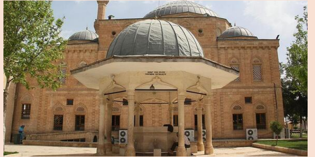
Eyyüp Peygamber ve Makamı