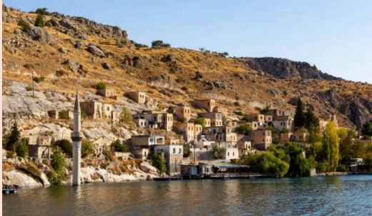
Batık Şehir Halfeti