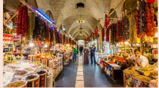
Bayazhan Gaziantep Kent Müzesi